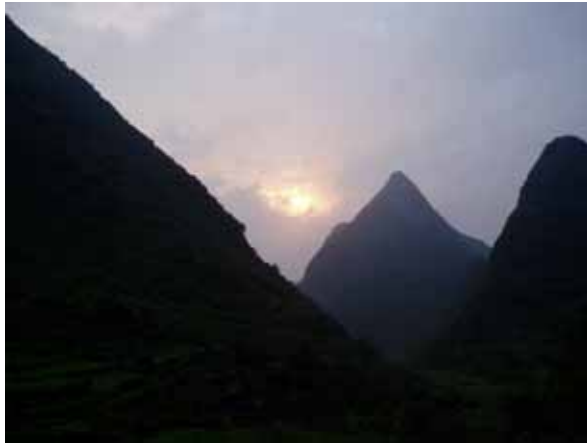
陽山的群山與日落